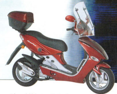
Abgebildetes Zubehör gegen Aufpreis.