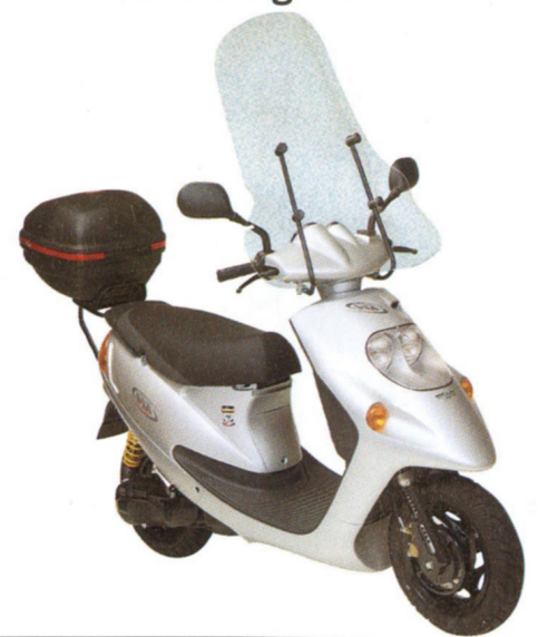
Abgebildetes Zubehör gegen Aufpreis.